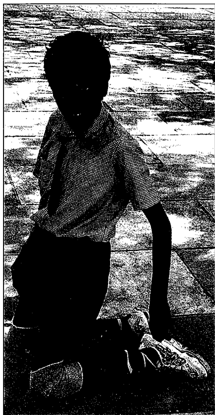
Un niño con parálisis cerebral espástica camina de rodillas, las cuales están protegidas con esponjas.

Además de las clases de karate, el Centro SPASTN les ayuda a los niños con parálisis cerebral a que amplíen su capacidad. En vez de tratar de "normalizar" a los niños discapacitados para que hagan las cosas como los niños no discapacitados, les enseñan a hacer cosas de la manera más fácil posible y que mejor funcione para ellos.