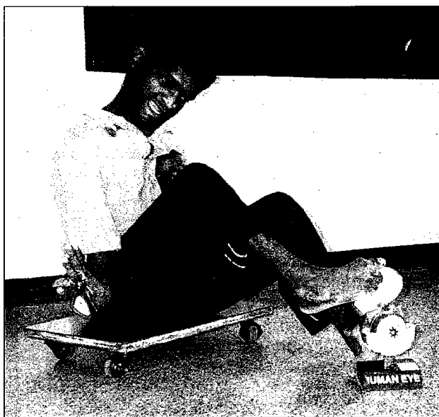
Este muchacho, sentado sobre su patineta arma con los pies un complicado rompecabezas del ojo humano.

Además de las clases de karate, el Centro SPASTN les ayuda a los niños con parálisis cerebral a que amplíen su capacidad. En vez de tratar de "normalizar" a los niños discapacitados para que hagan las cosas como los niños no discapacitados, les enseñan a hacer cosas de la manera más fácil posible y que mejor funcione para ellos.