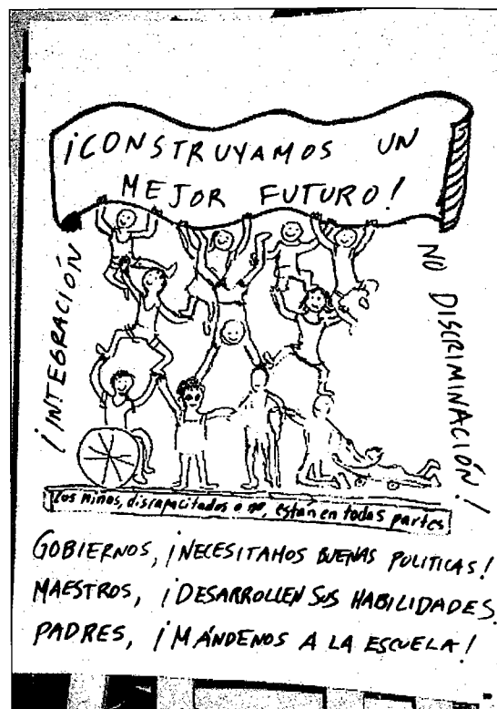
Este cartel se hizo en una sesión de entrenamiento durante el seminario mundial de la Fundación Save the Children (Fundación Salve a los Niños), en 1994.